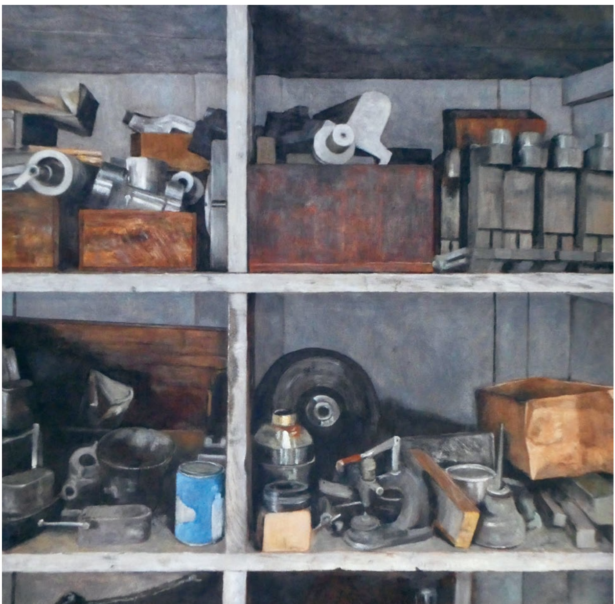
La fabbrica XXIII, huile sur panneau, 2018

Exposition du 25 août au 15 septembre 2019