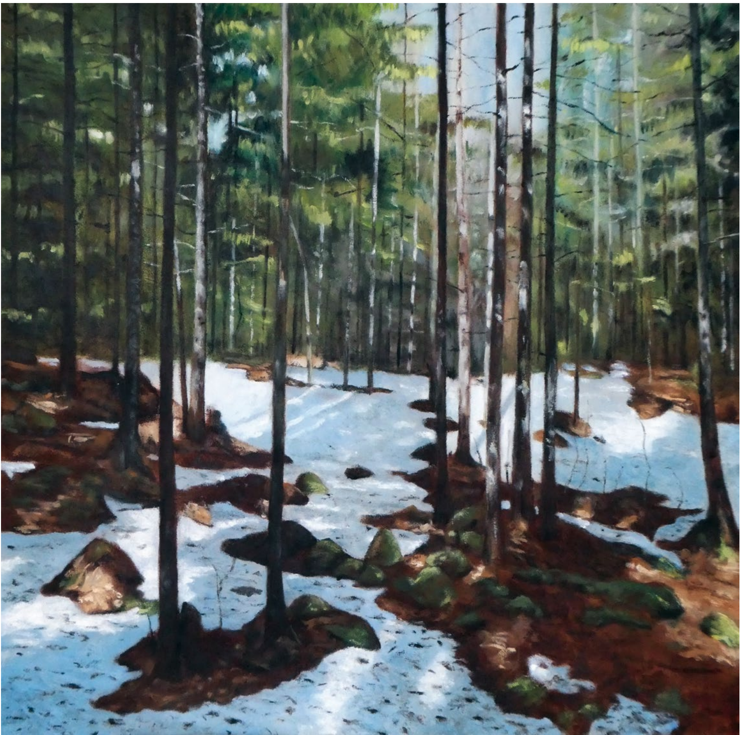
La foresta XXVI, huile sur panneau, 2019

Exposition du 25 août au 15 septembre 2019